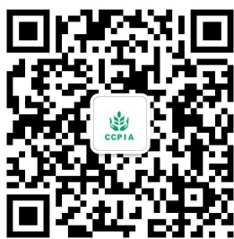
中国农药官方微信平台

会议将围绕农药管理新规和“十二五”农药行业发展规划，关注行业法规的颁布与实施，聚焦技术创新、清洁生产、责任关怀等热点话题，追踪跨国公司发展战略调整及全球农药市场变幻，邀请国家相关部委领导、国内外资深专家、学者、优秀企业家等作精彩解读与分析，针对目前国内外农药市场现状和未来发展趋势展开广泛讨论，举办“第九届作物保护国际论坛”、“第九届市场采购与服务国际论坛”、“第六届中国农药工业高峰论坛”、“2014中国农药新产品新技术发布会”、“第一届全国农药行业环保发展论坛”和“农化产品展览会”。同期将举办“第七届中国农药创新贡献奖”颁奖活动，发布中国农药行业第二批获得HSE认证的企业名单并首次隆重推出中国农药行业企业出口30强榜单。